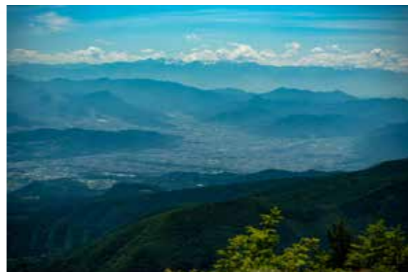
見晴岳からの眺望