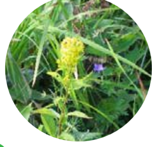
5 ミヤマアキノキンソウ