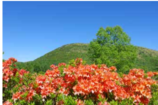
湯の丸山と レンゲツツジの大群生